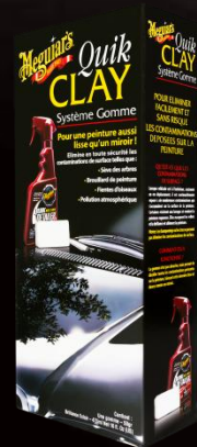
Système Gomme Quik Clay G1116

Vous pourrez détecter toutes les contaminations en surface telles que le brouillard de peinture, la résine des arbres ou les résidus de fientes d'oiseau en passant votre main sur la peinture après l'avoir lavée et séchée. Toutes ces petites rugosités peuvent être éliminées avec le Système Gomme Quik Clay.