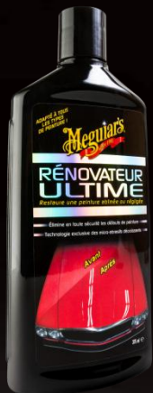
Rénovateur Ultime G17216