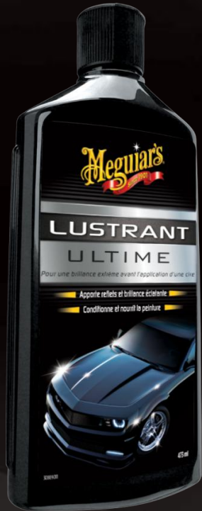
Lustrant Ultime G19216